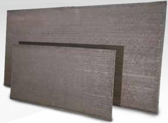
Placas dimensionadas según requerimiento

Algunos ejemplos de uso son los chutes de plantas mineras, Sinfines, Baldes de Cargadores, Tolva de Camiones, Baldes de Palas, Ciclones separadores, Paredes de Bombas, Ductos.