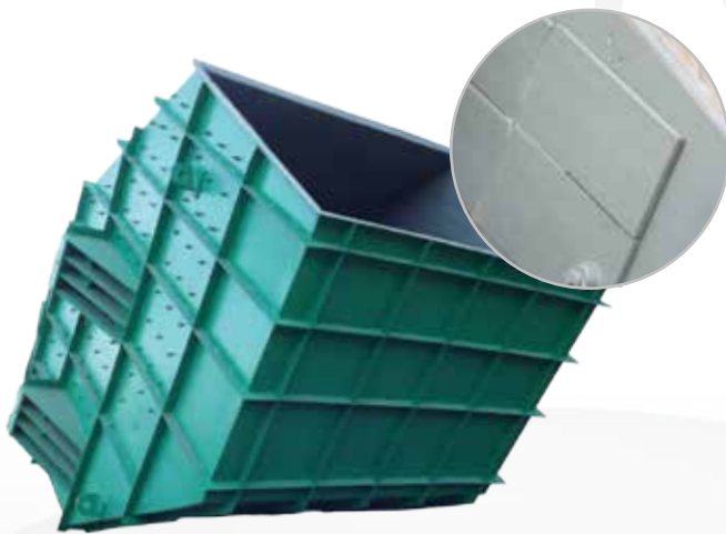
Chute reforzado en su interior